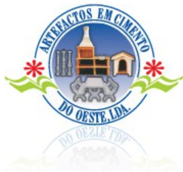
Churrasqueira Ref. Évora 001