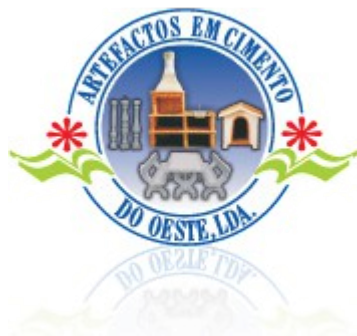
Churrasqueira Ref. Évora 003